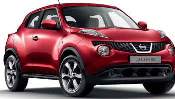
17" Alüminyum Alaşımli Jant