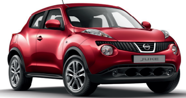
17" Sportif Alüminyum Alaşımli Jant